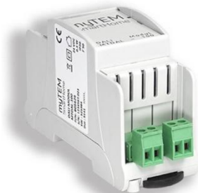
myTEM DALI Modul MTDAL-100

Das MTDAL-100 ist ein DALI Modul von myTEM mit dem Sie Ihr Smart Home System mit einer Steuerung für intelligente DALI Leuchten erweitern können. Über den DALI Bus können bis zu 64 DALI Produkte angesteuert werden.